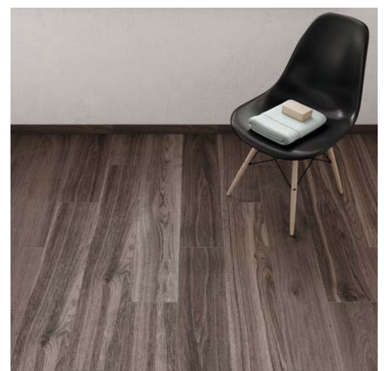
Motiv 7

Der gleiche Raum wird durch den kontrastierenden Boden in smokey brown „erdiger“, behält aber seine elegante Anmutung und Transparenz. Walden verbindet den Look von Holz mit den Vorzügen von Keramik, zum Beispiel die Eignung für Fußbodenheizungen oder die Unempfindlichkeit gegen Feuchtigkeit und Nässe.