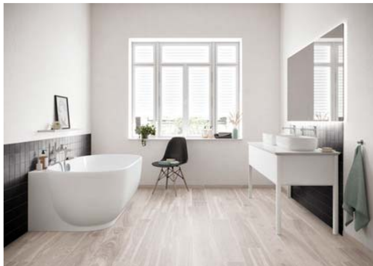
Motiv 5

Walden ist auch bestens geeignet für Badezimmer und Sanitärbereiche. Der hier gezeigte Farbton sunny white belegt ebenfalls die Wandelbarkeit und Vielseitigkeit der Serie: Der Ton-in-Ton gehaltene Raum wirkt harmonisch, luftig, leicht und modern.