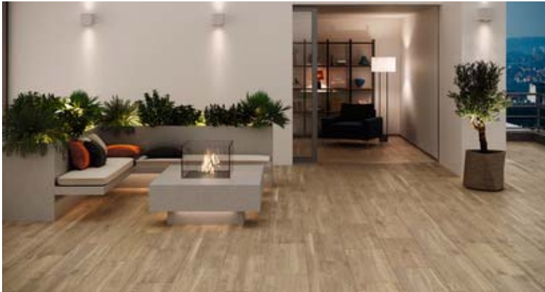
Motiv 3

Classic oak ist ein traditioneller Farbton, der aber in Verbindung mit zeitgenössischer Einrichtung einen fast schon luxuriös-mondänen Eindruck vermittelt. Innen und außen können nahtlos verbunden werden dank Terrassenplatten mit Trittsicherheit R11/B, um so bei jedem Wetter nicht nur einen eleganten, sondern auch einen „sicheren Auftritt“ zu bieten. Die Terrassenplatten sind mit 40 x 120 cm doppelt so breit, aber gleich lang wie das „Innenformat“ und somit schlüssig abgestimmt.