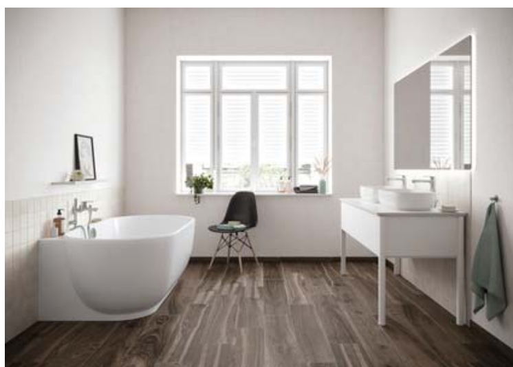
Motiv 6

Walden ist auch bestens geeignet für Badezimmer und Sanitärbereiche. Der hier gezeigte Farbton sunny white belegt ebenfalls die Wandelbarkeit und Vielseitigkeit der Serie: Der Ton-in-Ton gehaltene Raum wirkt harmonisch, luftig, leicht und modern.