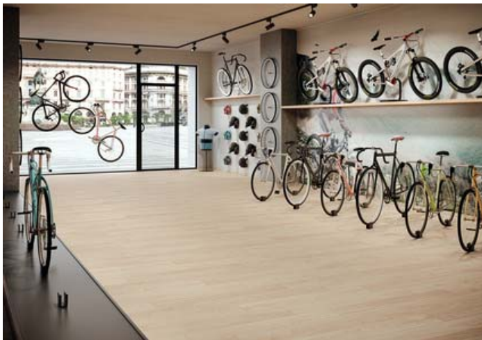
Motiv 1

Phone +49 (0)9435 / 391-33 79 Mobile +49 (0)160 / 90 52 71 59 Fax +49 (0)9435 / 391-30 33 79 Email werner.ziegelmeier@deutsche-steinzeug.de