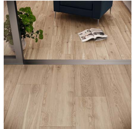
Motiv 4

Classic oak ist ein traditioneller Farbton, der aber in Verbindung mit zeitgenössischer Einrichtung einen fast schon luxuriös-mondänen Eindruck vermittelt. Innen und außen können nahtlos verbunden werden dank Terrassenplatten mit Trittsicherheit R11/B, um so bei jedem Wetter nicht nur einen eleganten, sondern auch einen „sicheren Auftritt“ zu bieten. Die Terrassenplatten sind mit 40 x 120 cm doppelt so breit, aber gleich lang wie das „Innenformat“ und somit schlüssig abgestimmt.